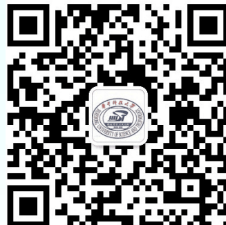
华中大研究生招生